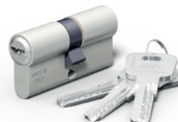
Serie 2120 - 2122 con chiave piatta