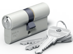
Serie 120 con chiave a cresta

compatibile con tutti i cilindri a profilo europeo, camma DIN