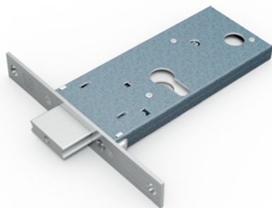
Serie 1381 - 1781 serratura a catenaccio regolabile

Catenaccio a 2 mandate con meccanismo di esclusione della seconda mandata.