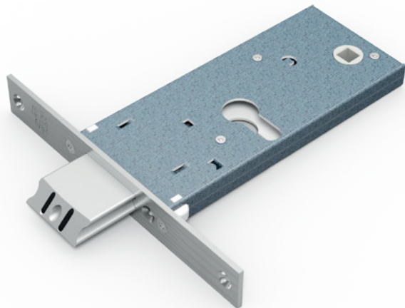
Serie 1380 - 1780 serratura a scrocco regolabile con mandate

LA SICUREZZA OMECC IN JEANS, ANCHE CON CILINDRO EUROPEO